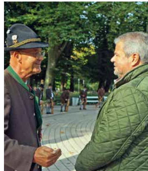
Ehrensalue der Salzburger Festungs-Prangerstutzen-Schützen