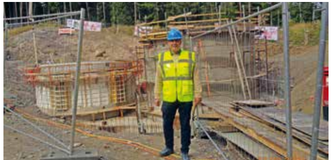
Besichtigung der Trinkwasserversorgungsanlage Gmeineck im Zuge der wöchentlichen Baubesprechung