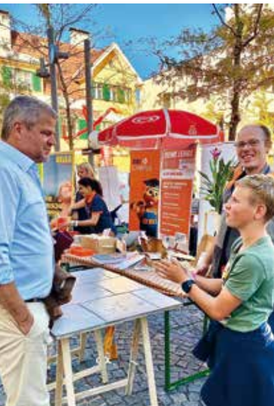
Berufsmesse am Rathausplatz