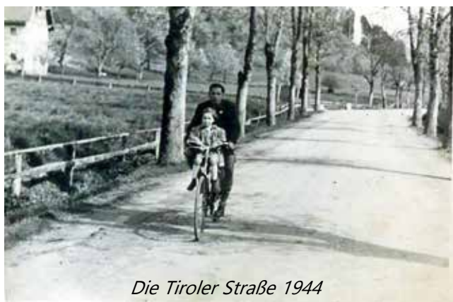
Die Tiroler Straße 1944