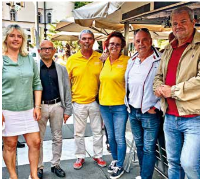
KollegInnen aus dem Gemeinderat