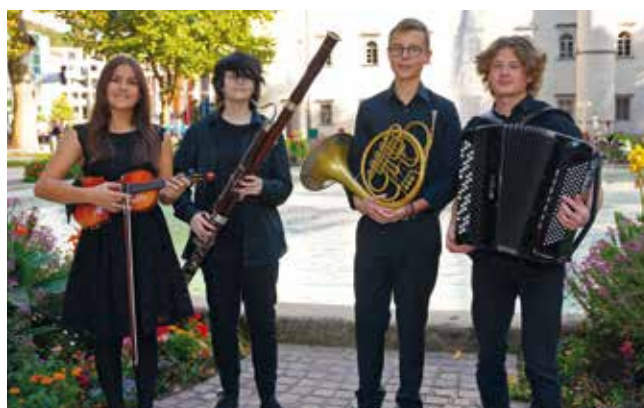
Das Ensemble StreichHolzBlechKnöpfe