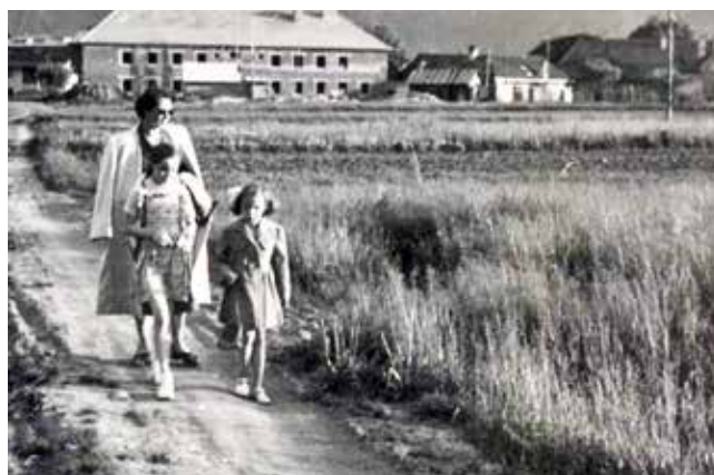
Peinten 1949: Bau des Altenwohnheims im Hintergrund