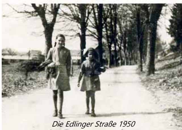
Die Edlinger Straße 1950