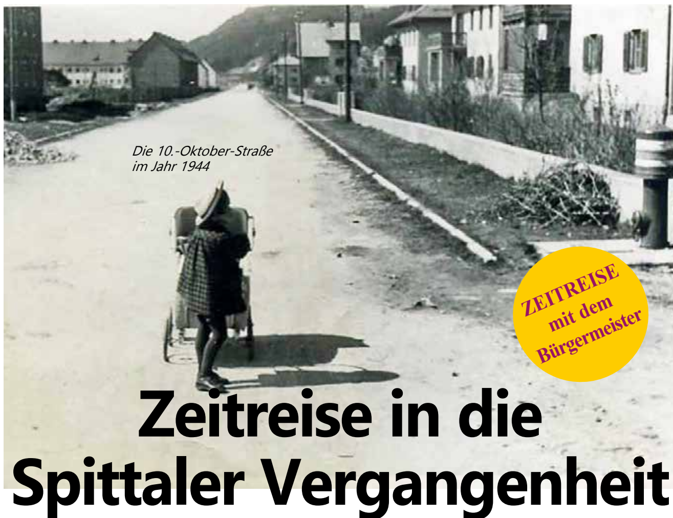
Die 10.-Oktober-Straße im Jahr 1944